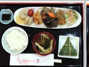
ちまきシューマイ 650円