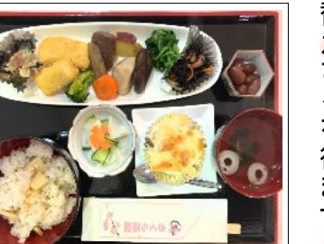
炊き込みご飯御膳 650円