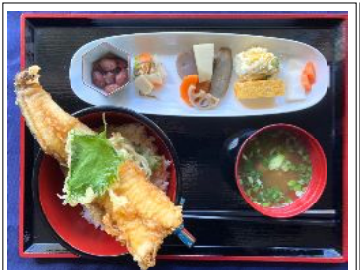
あなご天井 1000円 煮あなご/エビ天井 650円