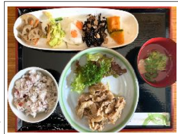
生姜焼きランチ 650円 鮭 弁当