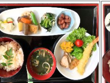
炊き込みご飯御膳 650円