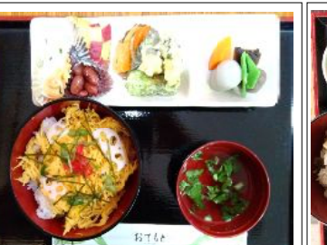
チラシご飯セット 650円