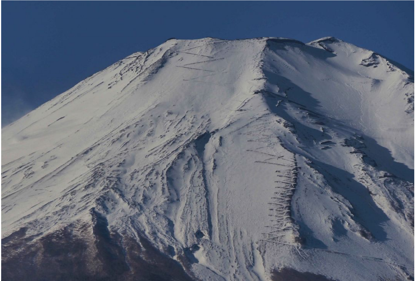
=冬の富士山= 写真中央に見えるジグザクは「登山道」です