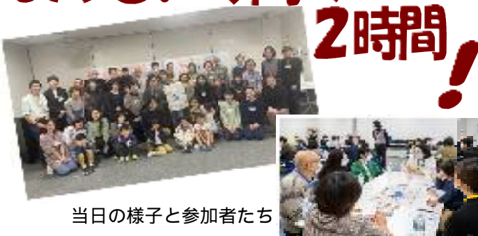
当日の様子と参加者たち

地域の有志でつくる「まちの未来研究会」主催の第2回目の「すごろくトーク」が、12月11日金沢公会堂で開催されました。