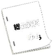
さくら茶屋ランチ・弁当提供数の推移

2017年に提供数が年間一万食を超え、それが4年ほど続きましたが、2010年のコロナ発生以降テイクアウト販売となり減少、昨年度トータルで一万食を回復、店内飲食も徐々に増えてきています。