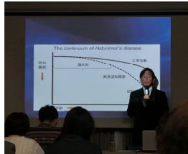
スライド利用で講演されました

説 治療薬のあり方や、妄想とか徘徊という症状は対策によってほぼ治療が可能なこと等 病院外来の認知症治療に係わる現状 「認知症を地域で支える仕組みづくり」の海外の例や、先生も実際に係わっておられる川崎にある認知症カフェ「土橋カフェ」の例などについて解説されました。