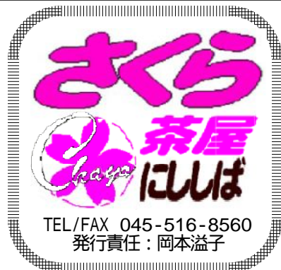
「さくら茶屋」と、「さくらカフェ」の様子