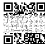
「さくら茶屋」ホームページ QRコードです