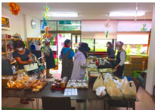
さくらカフェでのテイクアウト販売の様子

6月に「さくらカフェ」で販売していたお弁当などのテイクアウト商品を、7月1日からは「さくら茶屋」に移して販売することに致しました。 あわせて「さくらカフェ」では「三密」を避けながらの飲食をして頂けるようになります。但し、お買い求め頂いたお弁当などを持ち込んでお召し上がり頂きます。お水、お茶のサービスを行います。尚、お弁当などのご精算は「さくら茶屋」にてお済ませ下さい。 飲食の際は「三密」を防止するため以下の点をお守りください。 発熱や咳など異常が認められる方はご遠慮下さい