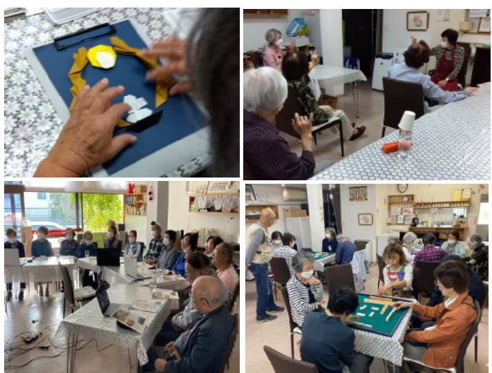
左上：折り紙教室でお月見を / 右上：げんきライフで頭の体操 / 左下：さくらカフェで歌の集い / 右下：麻雀教室風景