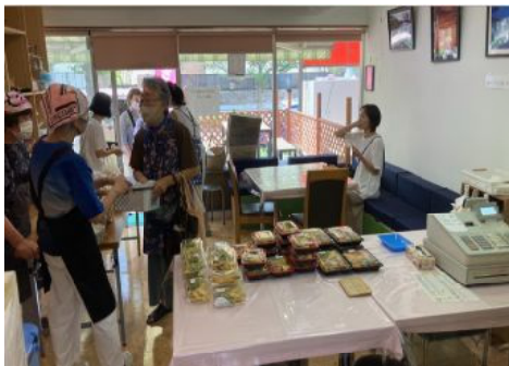
「さくら茶屋」の一部に店内飲食コーナー、テイクアウト販売終了後は飲食コーナーの拡大も

今年の5月以降行動制限もなくなり、飲食業へ客足が戻ってきたといわれています。そうした動きに合わせ「さくら茶屋」でもコロナ禍のテイクアウト販売から店内飲食への転換を徐々に進めていきます。皆さまのご利用をお待ちしています。